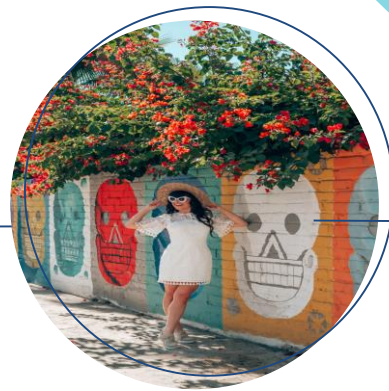
GALERIAS DE ARTE