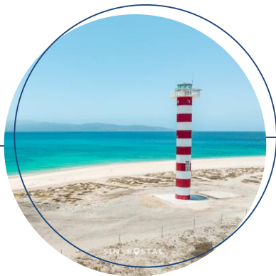
PLAYA PUNTA ARENA