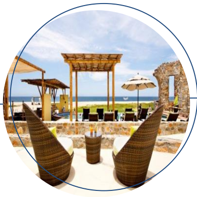
CLUB DE PLAYA GUAYCURA