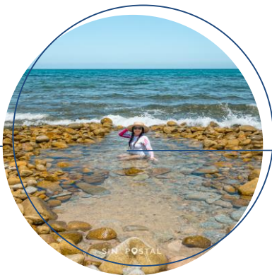
AGUAS TERMALES EL SARGENTO