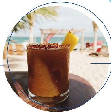
LA VENTANA BEACH CLUB