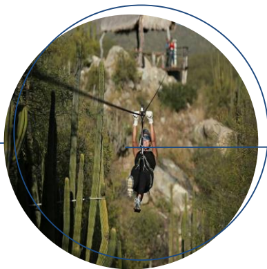
TIROLESA "LAS CABAÑAS"