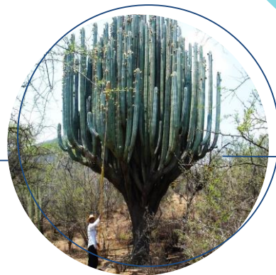
SANTUARIO DE "LOS CACTUS"