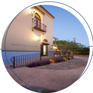
MUSEO DE LA PLATA